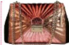
Giuseppe € 54,95