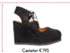
Castafier € 195