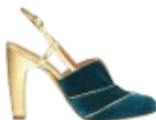
Chie € 280

In stampe orientali o damascato, con l'abito a vestaglia, sopra i pantaloni fluidi in pizzo: per un look di raffinata modernità.