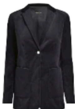
That's All Folks by Pennyblack €239