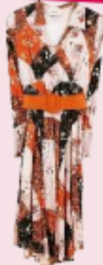
Dizie € 149