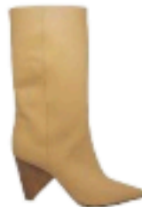
Aldo Castagna €349