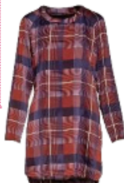
Anonyme Designers € 105