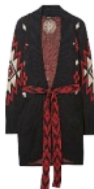
Desigual € 149,95