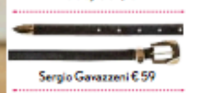
Sergio Gavazzeni € 59