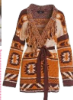
Compagnia Italiana € 145

Le mantelle in maglia, i giacconi jacquard e i ponchos folli: così si ridisegna il volto dei capispalla invernali. E grazie a un gioco di stratificazioni, trench e cappotti non saranno più gli stessi.