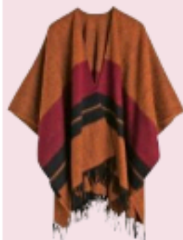
& Other Stories € 79