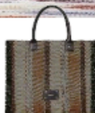
Uterqüe € 75