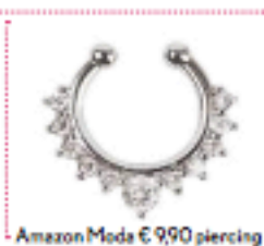
Amazon Moda € 990 piercing