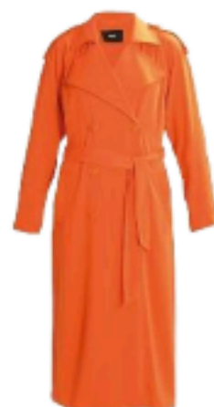
Cindy su zalando.it € 5999