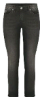
Miss Miss € 99