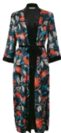
Paperlace London € 183