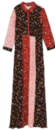
Zara € 49,95