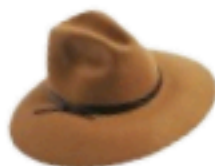
Alpha Studio €100