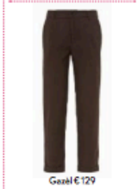
Gazél € 129