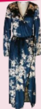
Keos su yook.com € 114