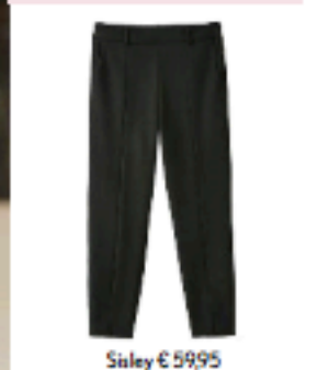
Staley € 59,95