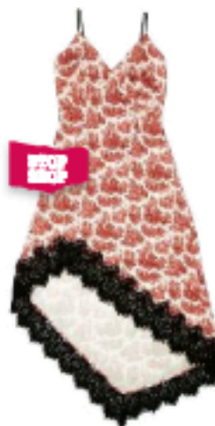
SH by Silvan Heech €74,99