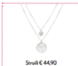
Stroili € 44,90