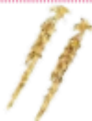
Rosantica su net-a-porter.com €135