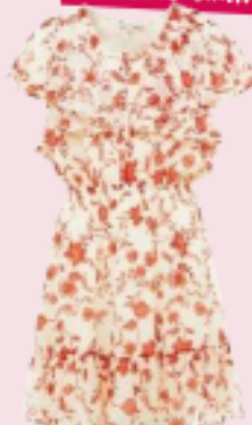
Rebecca Minkoff su zalando.it €274