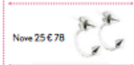
Nove 25 € 78