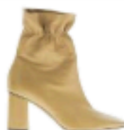
Fabio Rusconi € 253