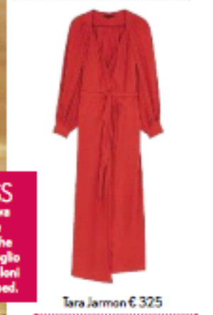
Tara Jarmon € 325