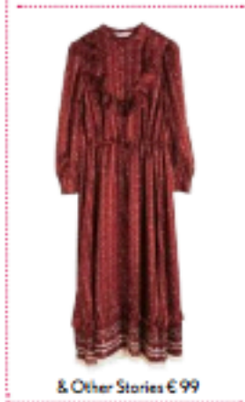
& Other Stories € 99