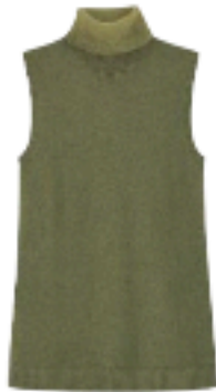
Cos € 59