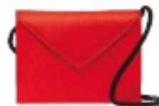
Elizabeth and James su net-a-porter.com € 125