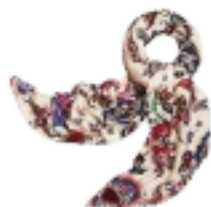
Tory Burch € 195